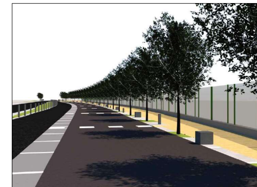
Nova ordenació de l'àrea d'aparcament