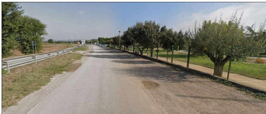
Estat actual de l'àmbit d'actuació