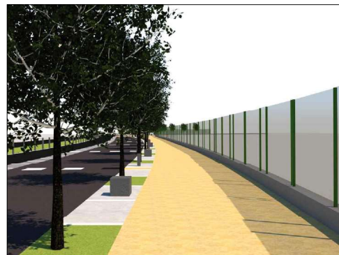
Nous espais arbrats de vianants