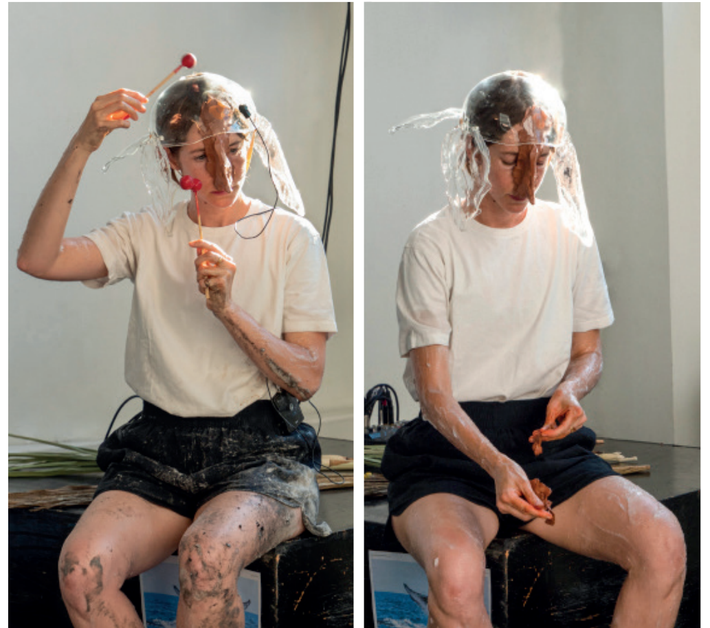
Imatges inspiracionals del procés de creació