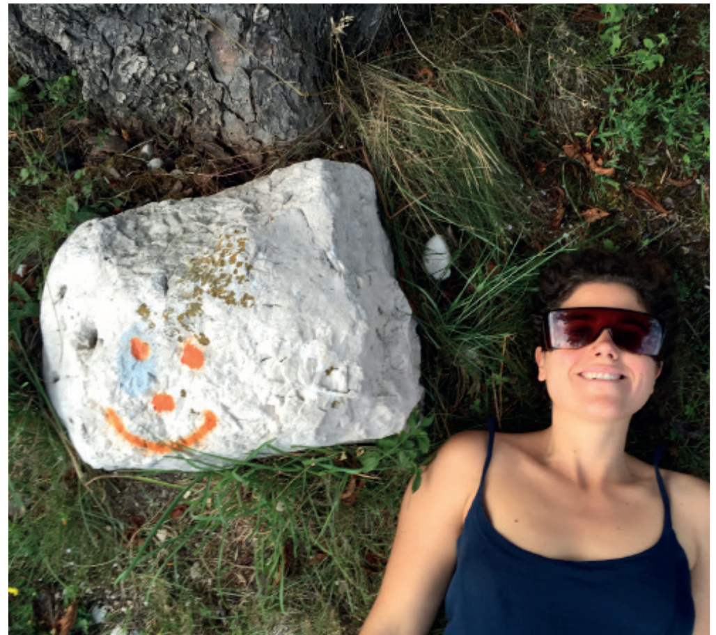
Imatge inspiracional del procés de creació