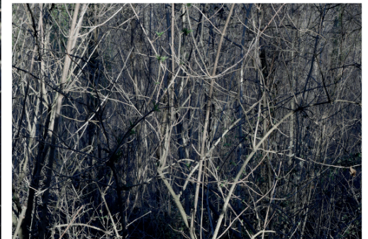
Imatges inspiracionals del procés de creació