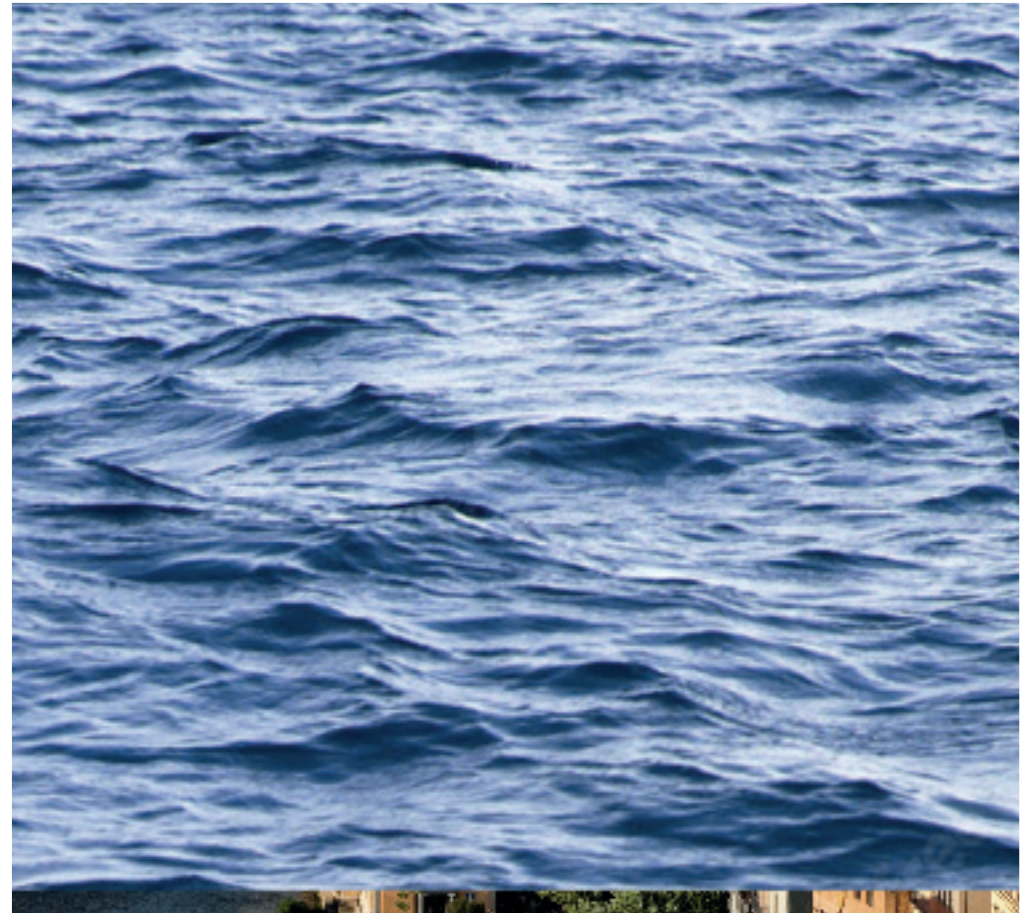
Imatge inspiracional del procés de creació