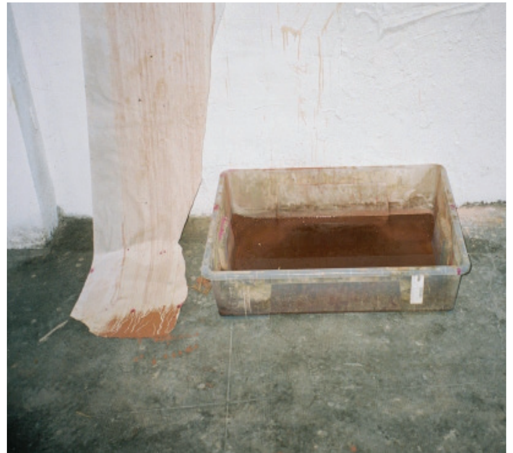
Imatge inspiracional del procés de creació

www.instagram.com/martinllavneras/?hl=es