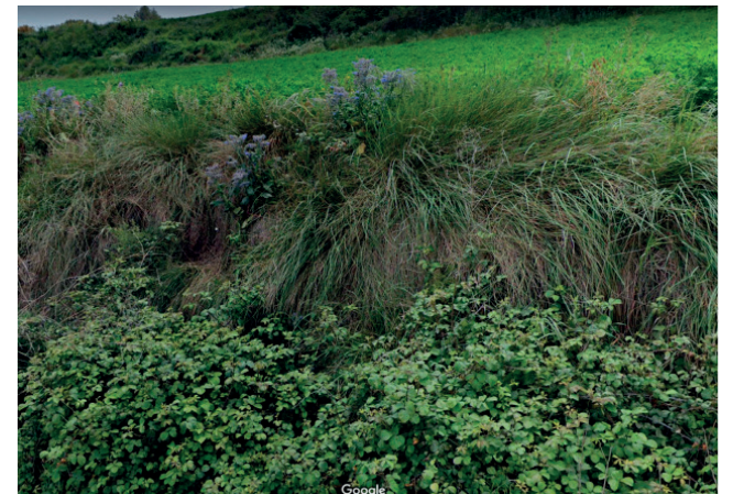
Imatges inspiracionals del procés de creació