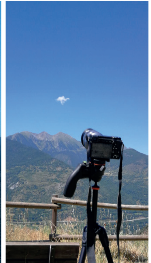
Imatges inspiracionals del procés de creació