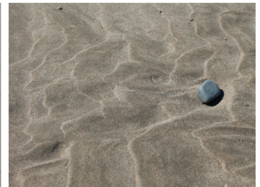
Imatges inspiracionals del procés de creació