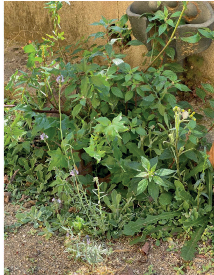
Imatge inspiracional del procés de creació