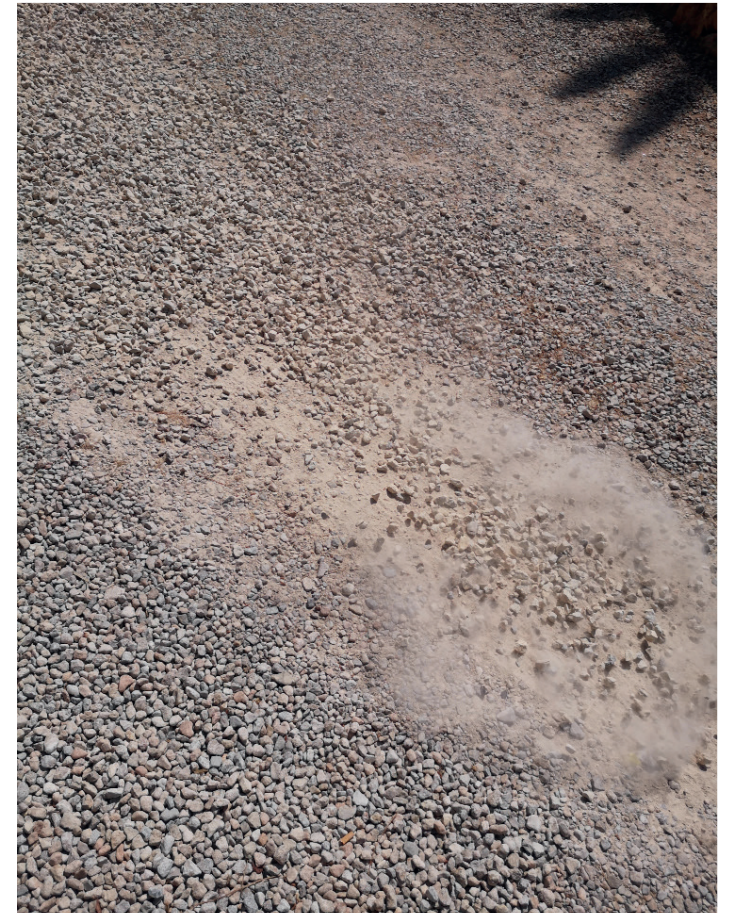
Imatge inspiracional del procés de creació

noelacovelovelasco.net www.instagram.com/noelacove/?hl=es