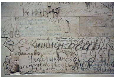
Parets del Reichstag

El graffiti en els seus orígens més ancestrals parla del fet de que un ésser humà va ser a un lloc del món i en un moment concret de la història i hi va deixar la seva empremta. D'ençà que el temps és temps, hi ha hagut homes que han deixat la seva signatura en un mur per dir: jo he estat aquí, existeixo i sóc testimoni.