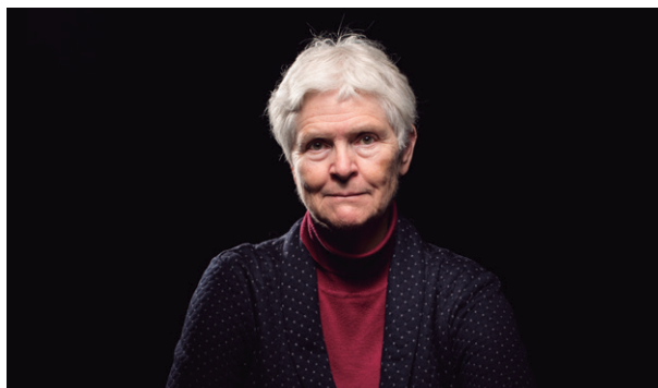
Inger Enkvist

La pedagoga sueca Inger Enkvist serà una de les principals veus internacionals amb què comptarà el cicle. La catedràtica emèrita de literatura de llengua espanyola a la Universitat de Lund, Suècia, i autora de nombrosos llibres sobre educació, impartirà una xerrada envers la forma en què els alumnes desenvolupen l'esperit crític, la creativitat i la capacitat de comunicació. Sota el títol Educar per pensar (11 de novembre, 19h, Espai Plana de l'Om), la pensadora incidirà en la importància d'adquirir coneixements i ser flexible en l'època de la informàtica.