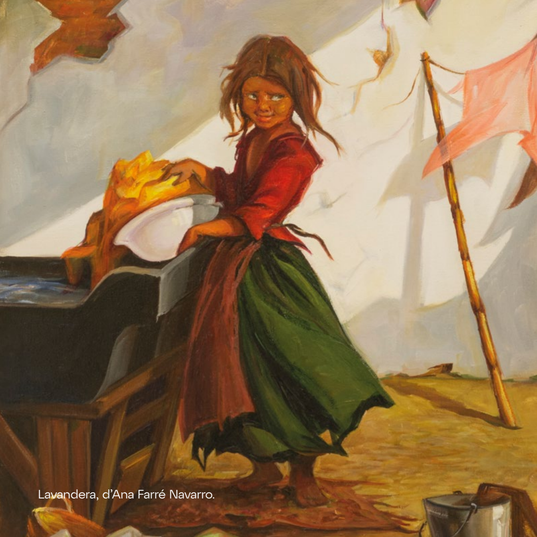
Lavandera, d'Ana Farré Navarro.