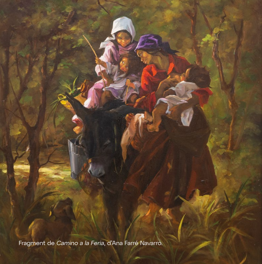
Fragment de Camino a la Feria , d'Ana Farré Navarro.