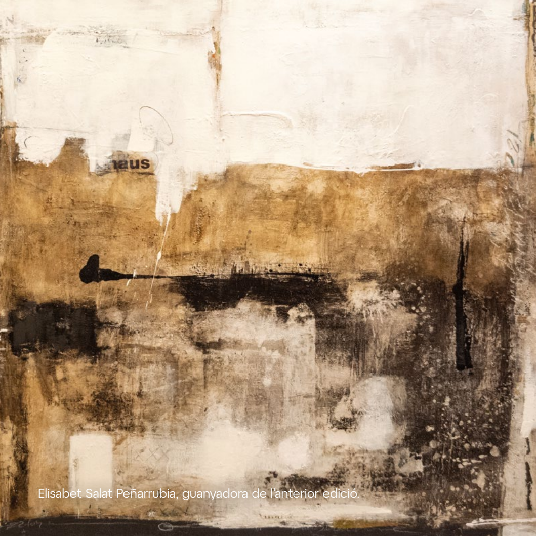
Elisabet Salat Peñarrubia, guanyadora de l'anterior edició.